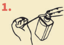
ASHKA JUPUQUQ CHURAKUY