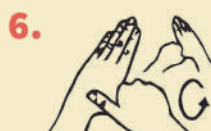
MAMA RUKANATA MAKI UYAWAN QAQUY