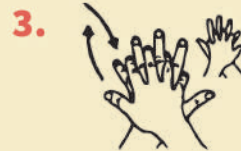
MAKI UYATA JUJ MAKI UYAPIQA PATANPI CHURAY, RUKANAKUNATA TAKUCHIY