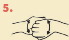
KUNANQA ÑAWPI RUKANAKUNA