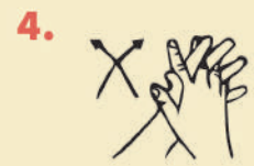
MAKI UYAKUNATA TINKUCHIY RUKANAKUNATA TAKUCHIY